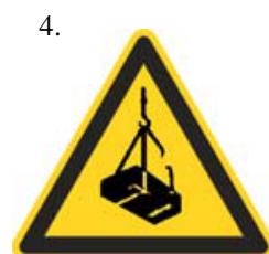
Nebezpečenstvo pádu alebo pohybu zaveseného bremena