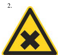
Nebezpečenstvo škodlivej alebo dráždivej látky