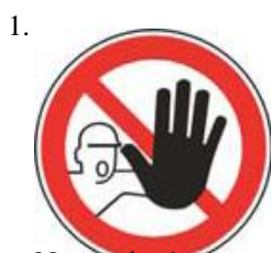
Nepovolaným vstup zakázaný (spolu so značkou č.2, 3 alebo 4 a príslušnou dodatkovou tabuľou)