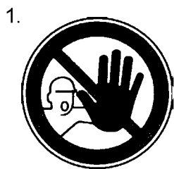
Nepovolaným vstup zakázaný (spolu so značkou č.2, 3 alebo 4 a príslušnou dodatkovou tabuľkou)