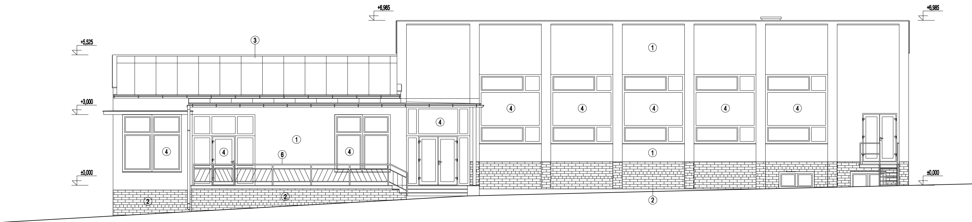
VÝCHODNÝ POHĽAD - Pôvodný stav