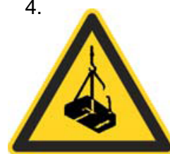
Nebezpečenstvo pádu alebo pohybu zaveseného bremena