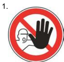
Nepovolaným vstup zakázaný (spolu so značkou č.2, 3 alebo 4 a príslušnou dodatkovou tabuľou)