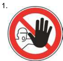
Nepovolaným vstup zakázaný (spolu so značkou č.2, 3 alebo 4 a príslušnou dodatkovou tabuľou)