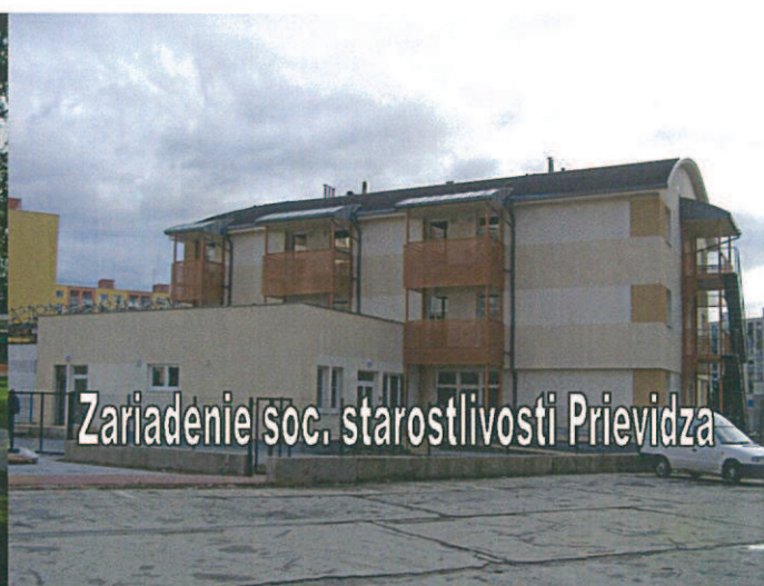
Zariadenie soc. starostlivosti Prievidza