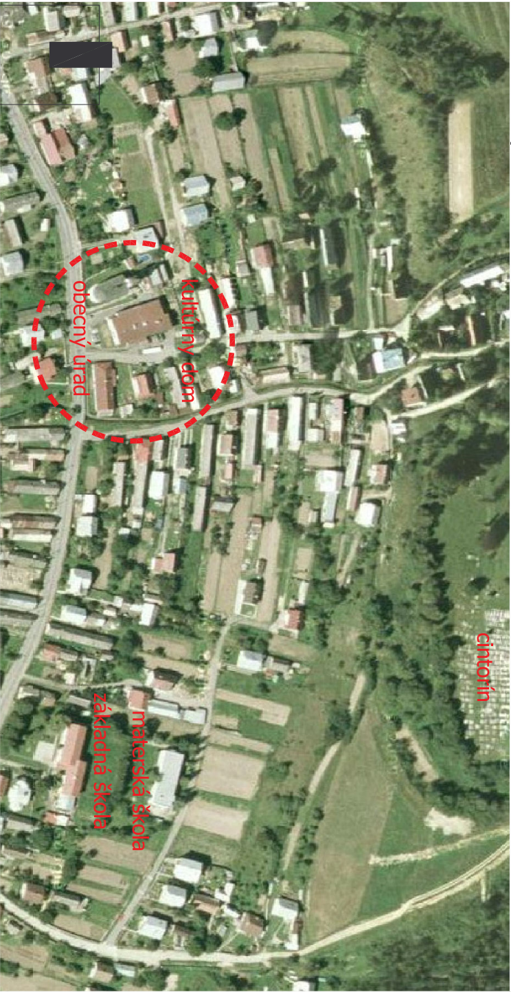
ortofotomapa centra obce