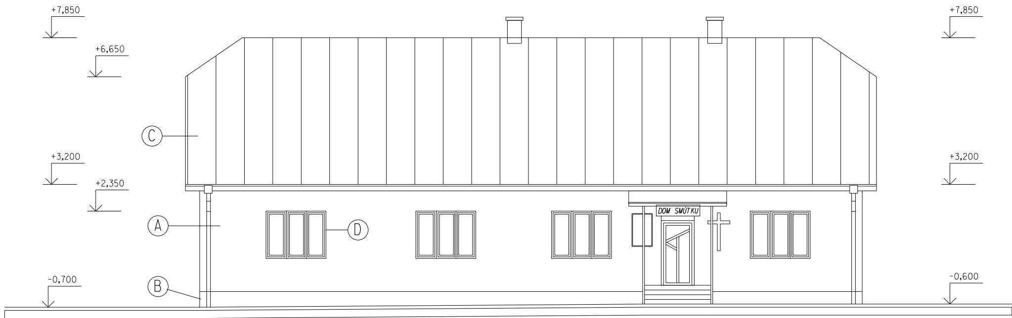
POHLAD ČELNÝ (V) - STARÝ STAV