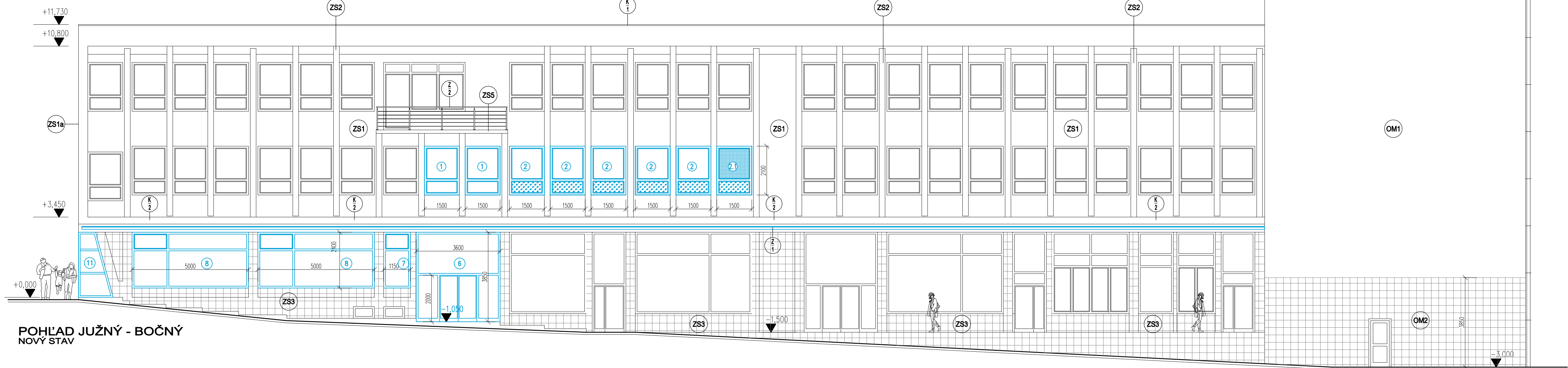
POHLAD JUZNY - BOCNY NOVY STAV