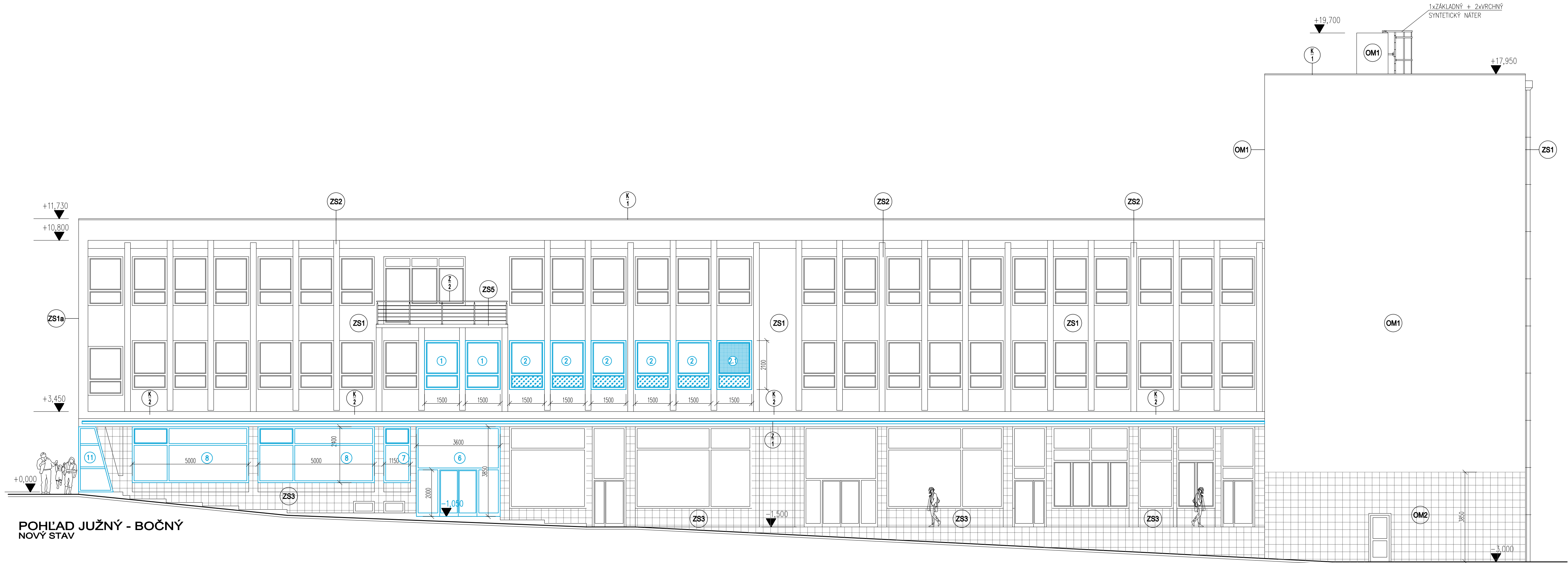
POHLAD JUZNY - BOCNY NOVY STAV