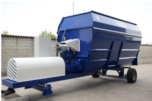
Ilustrační foto: Podvozek pouze k přepravě na místo