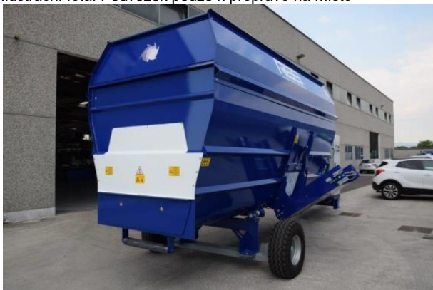
Ilustrační foto: Míchací vana