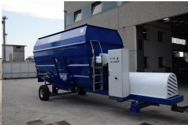
Ovládací skříň elektroverze