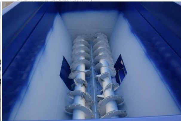
řezací a homogenizační šneky