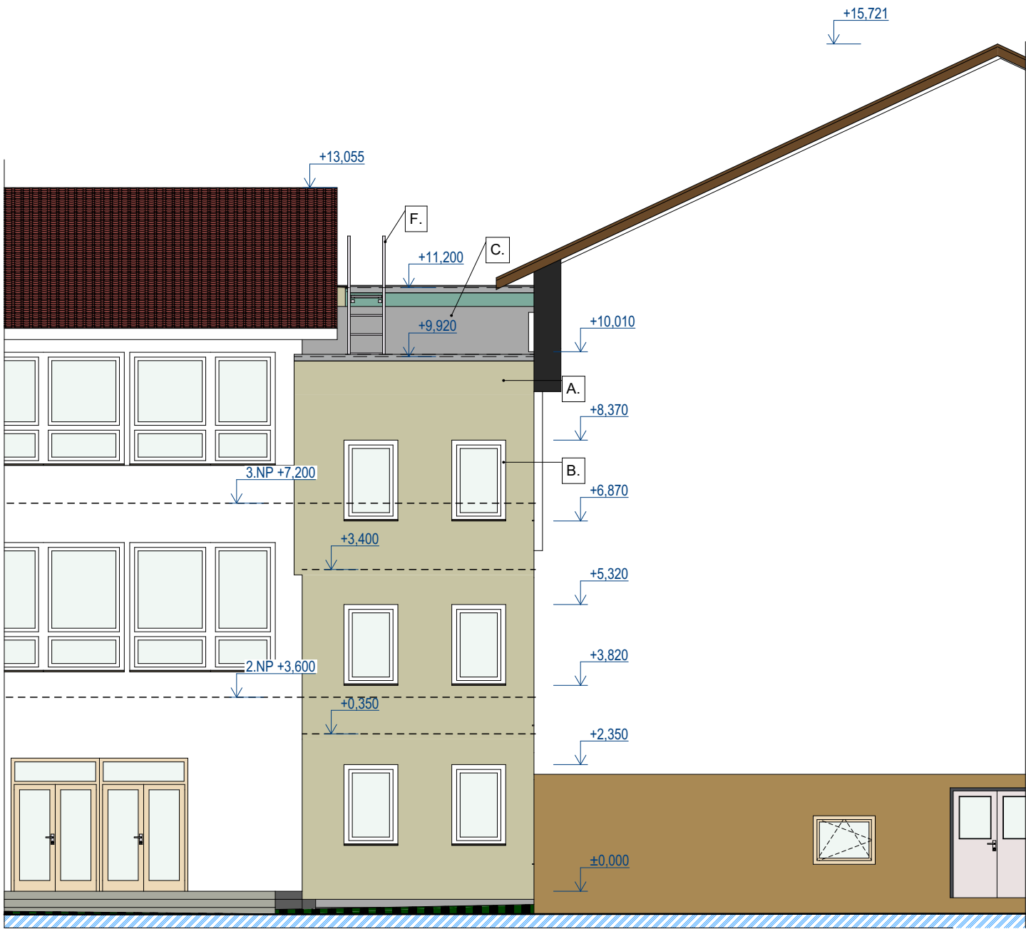
NAVRHOVANÝ SEVERNÝ POHLAD