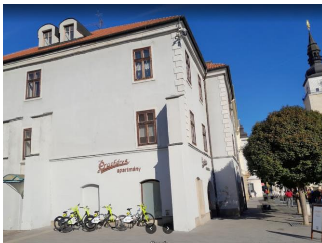
Obrázok č. 2 – Lokalizácia národnej kultúrnej pamiatky - meštiansky dom Pracháreň

Rozsah zákazky je riešený v realizačnej dokumentácii pre realizáciu stavby „Obnova a revitalizácia národnej kultúrnej pamiatky meštiansky dom Pracháreň“ spracovanou: Slovenská technická univerzita v Bratislave, Vazovova 5, 812 43 Bratislava, súčasť – Fakulta architektúry a dizajnu STU v Bratislave, Bellušove ateliéry, Námestie slobody 19, 812 45 Bratislava.