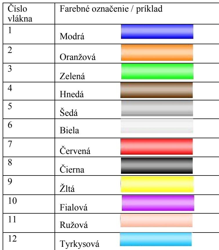
Tabuľka farebného značenia vlákien podľa EIA 598-A