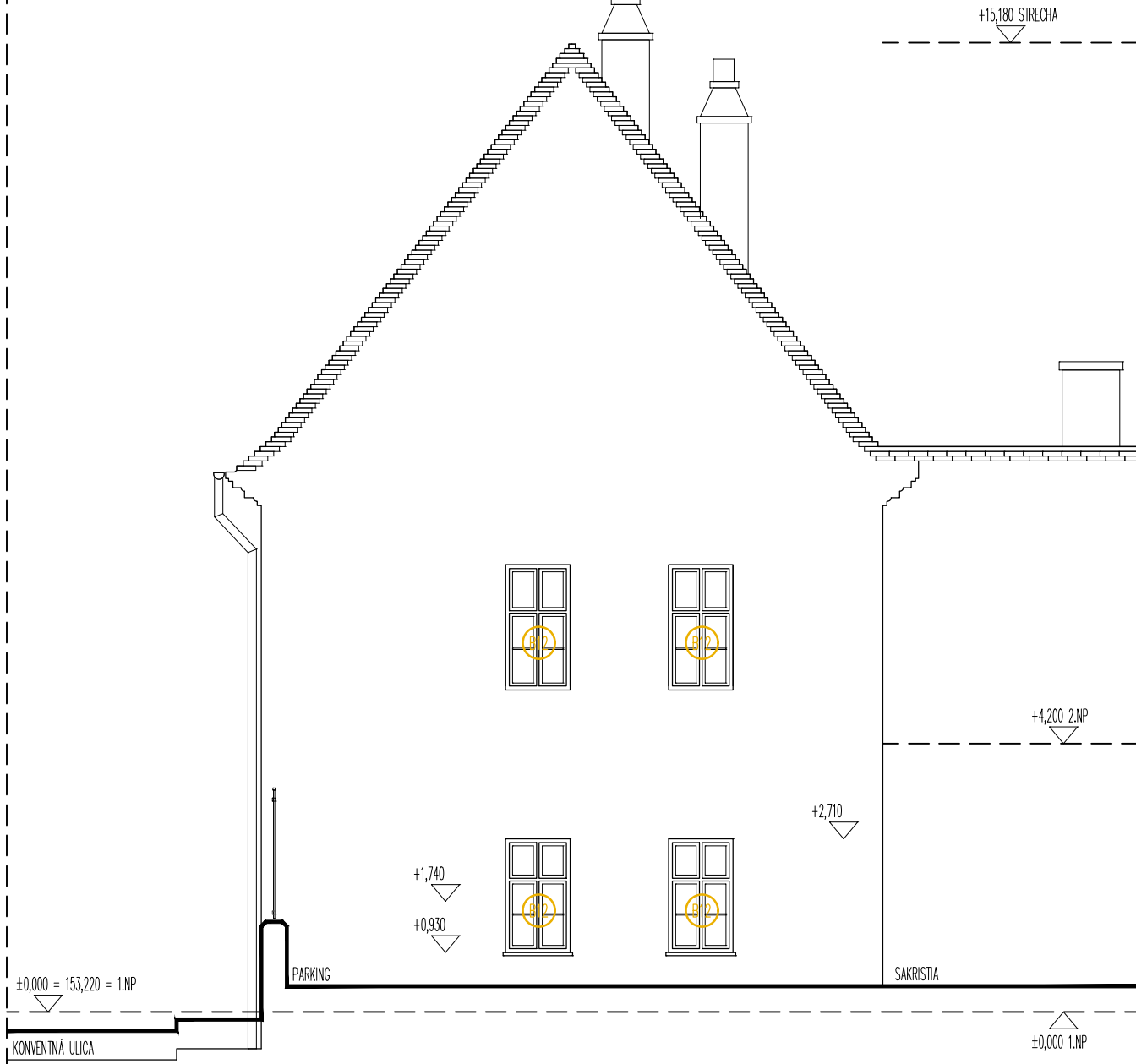
POHĽAD ŠTÍTOVÁ STENA SEVER