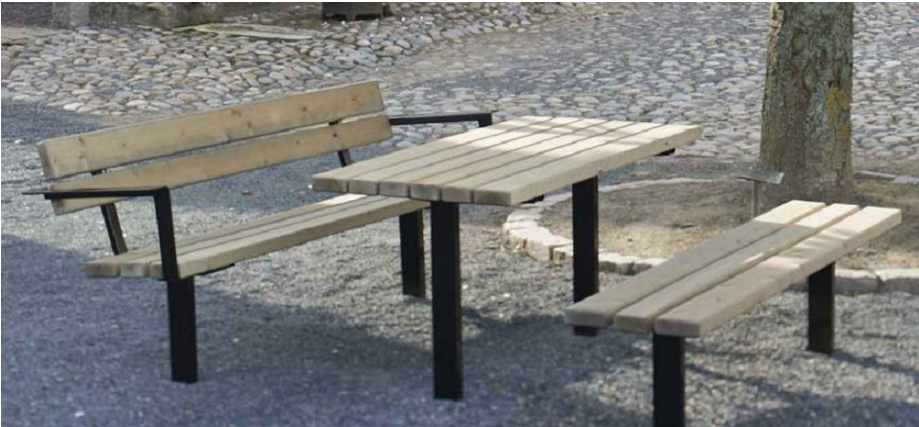
Parková lavička s podrúčkami a lavička bez operadla

Projektant nemal k dispozícii výškopis, polohopis ani zameranie inžinierskych sietí a podzemných objektov! Pred realizáciou je potrebné overiť a vytýčiť skutočný priebeh sietí a podzemných objektov! Projektant nenesie žiadnu zodpovednosť za zmeny uskutočnené bez jeho písomného súhlasu! Zhotoviteľ je povinný skutočné rozmery skontrolovať na stavbe!