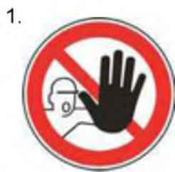
Nepovolaným vstup zakázaný (spolu so značkou č.2, 3 alebo 4 a príslušnou dodatkovou tabuľou)