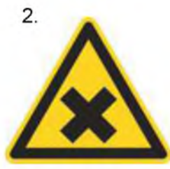
Nebezpečenstvo škodlivej alebo dráždivej látky