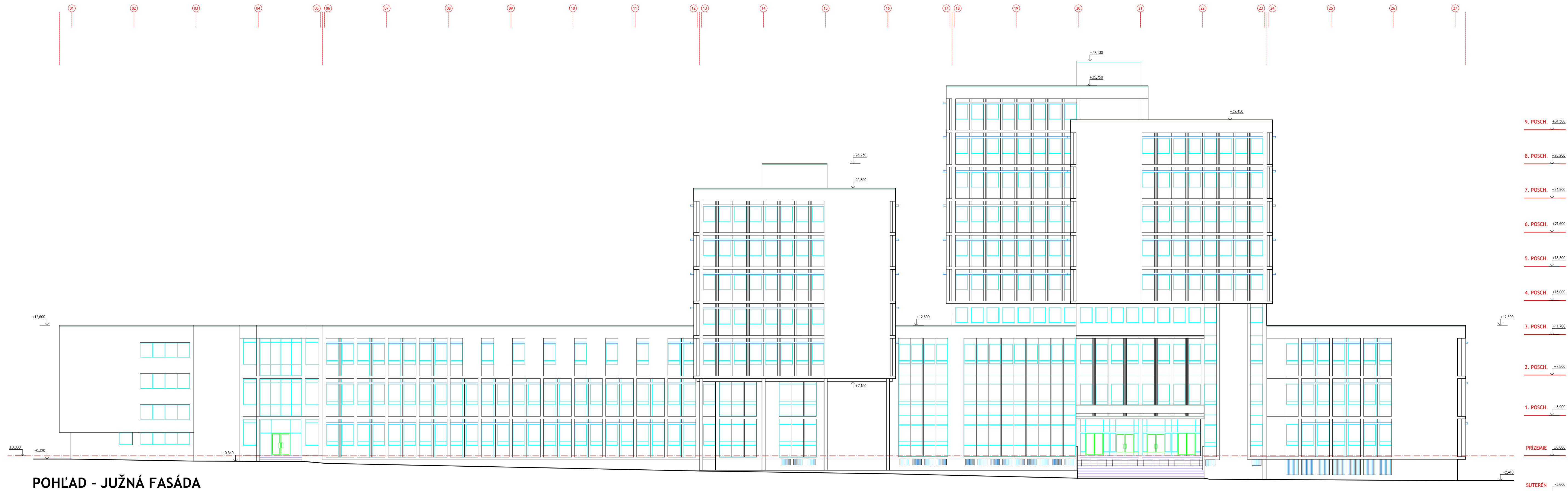
POHLAD - JUŽNÁ FASÁDA