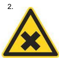
Nebezpečenstvo škodlivej alebo dráždivej látky