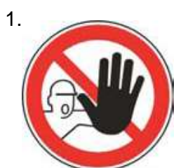
Nepovolaným vstup zakázaný (spolu so značkou č.2, 3 alebo 4 a príslušnou dodatkovou tabuľou)