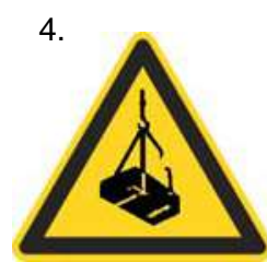
Nebezpečenstvo pádu alebo pohybu zaveseného bremena